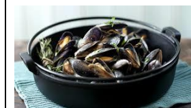
Mussels (moules) are cooked with garlic, cream; served with crusty bread.