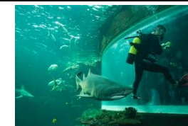
Nausicaa is Europe's biggest aquarium in Boulogne. It is a centre of scientific discovery focusing on man's relationship with the sea.