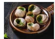
Snails (escargots) are edible land snails cooked with parsley butter, garlic and shallots.